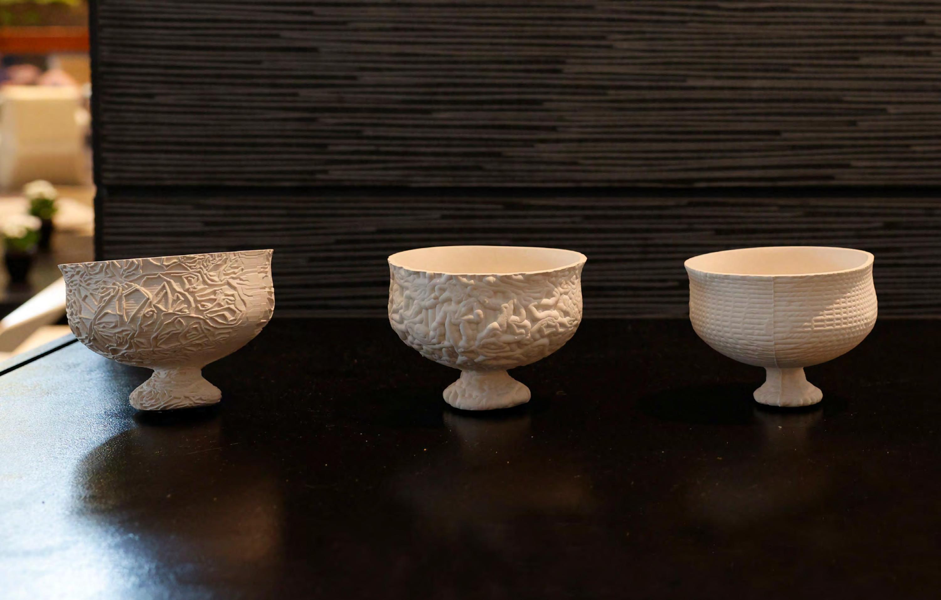
Kylix, קרמיקה בייצור דיגיטלי, 2020 Kylix, digitally fabricated ceramic, 2020

סריקה והדפסה תלת מימד של כלי עתיק מקפריסין. כחלק משימוש במכונה לצורך שחזור מעשי ידי אדם עתיקים.