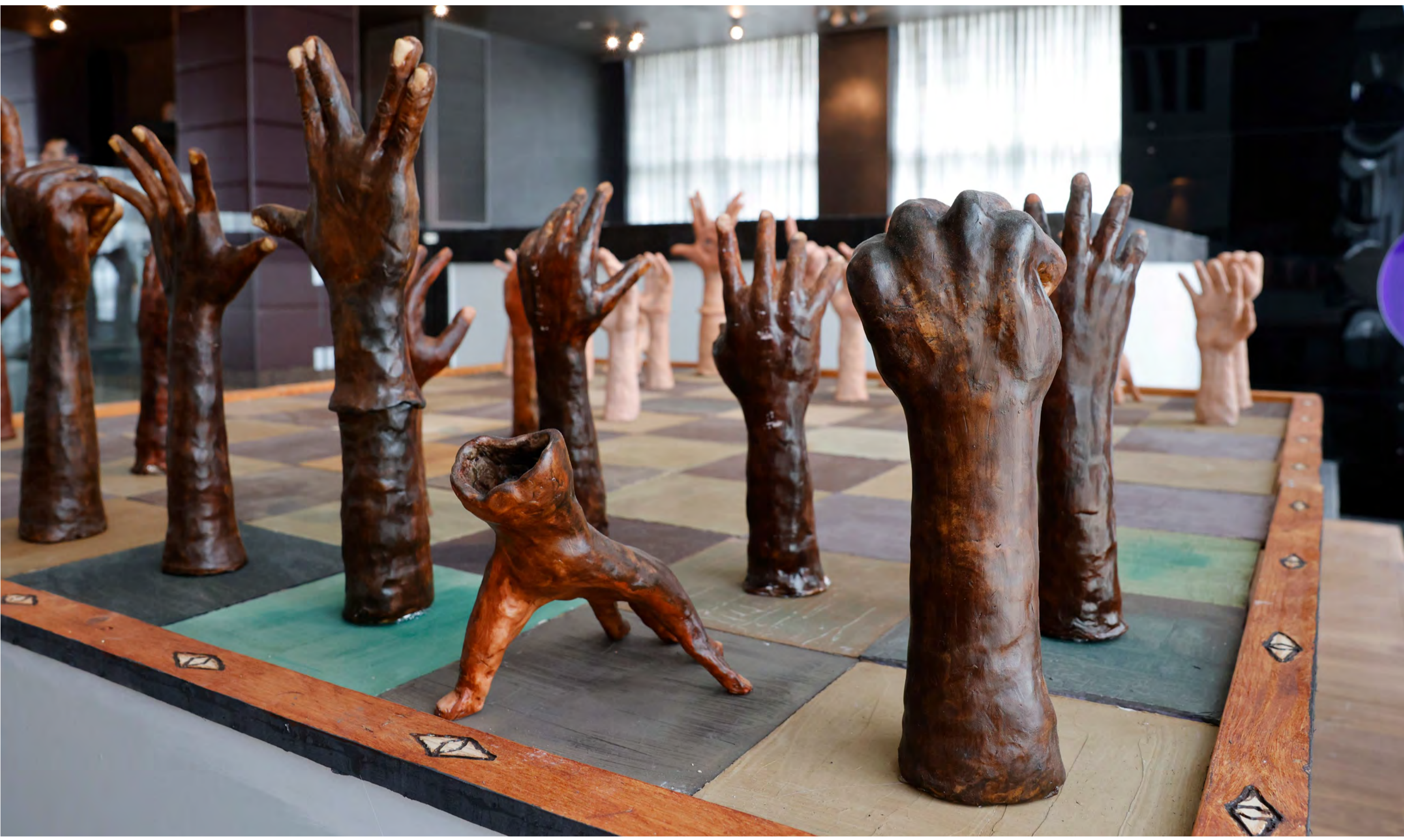
אבינועם שטרנהיים, שח הידיים, חימר פולימרי, 2023 Avinoam Sternheim, Hands Chess , polymeric paste, 2023

Click for the cards page לחצו לעמוד הקלפים