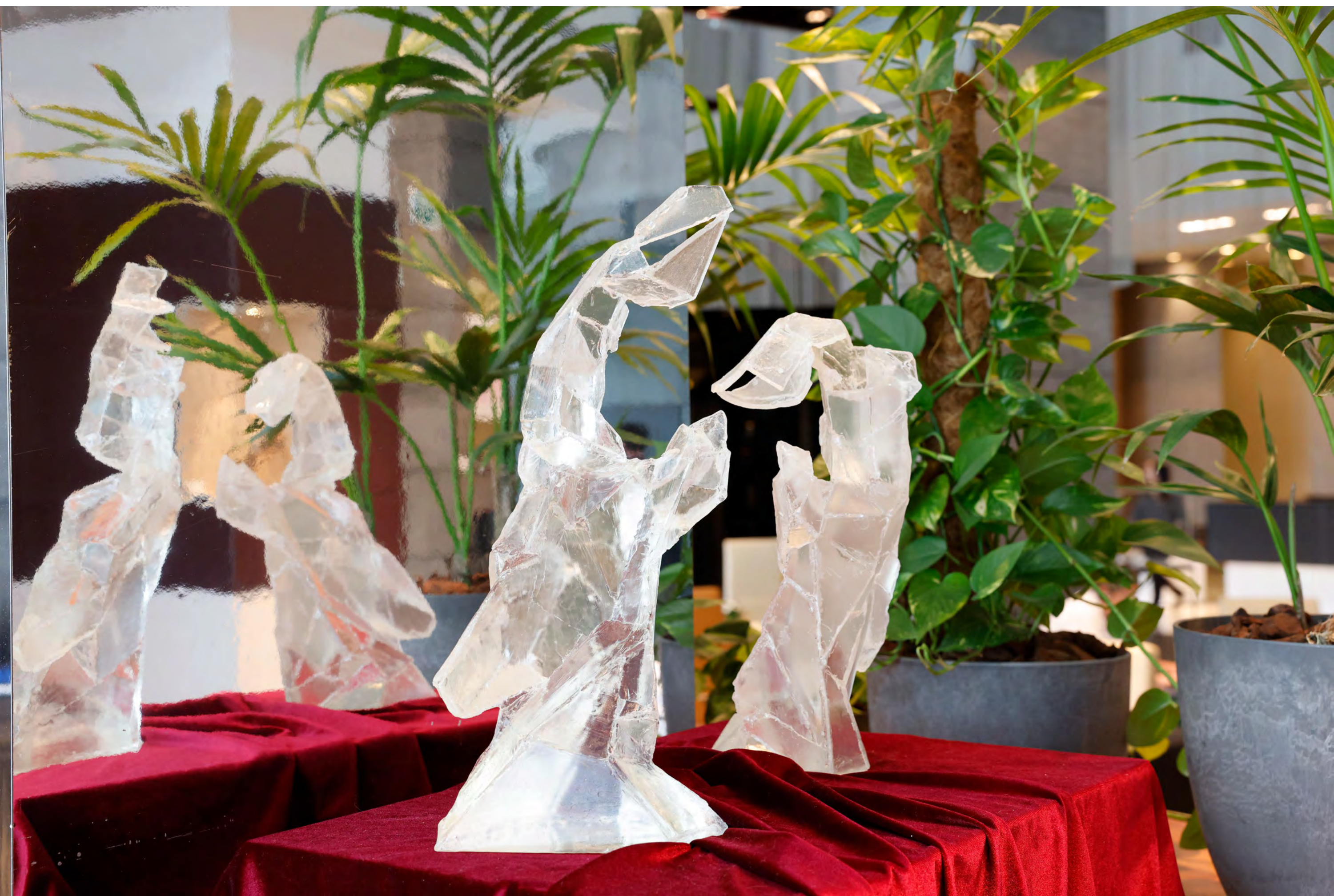
הילה ליזר בג'ה, שקופה, יציקת אפוקסי, 2023 Hila Laiser Beja, Transparent, epoxy casting, 2023

נפש האדם מופשטת ומתקיימת בכל מרחב פיזיוספיריטואלי. היא ביחסים סימביוטיים עם הקיום. היא בו זמנית, כל עוצמתית ושברירית, מגשימה חומר אך אה חומרית, היא האור והחושך. הבינה המלאכותית מתימרת לחשוב כמוח אנושי, האם תצליח היא להתעטף בנפש מלאכותית?