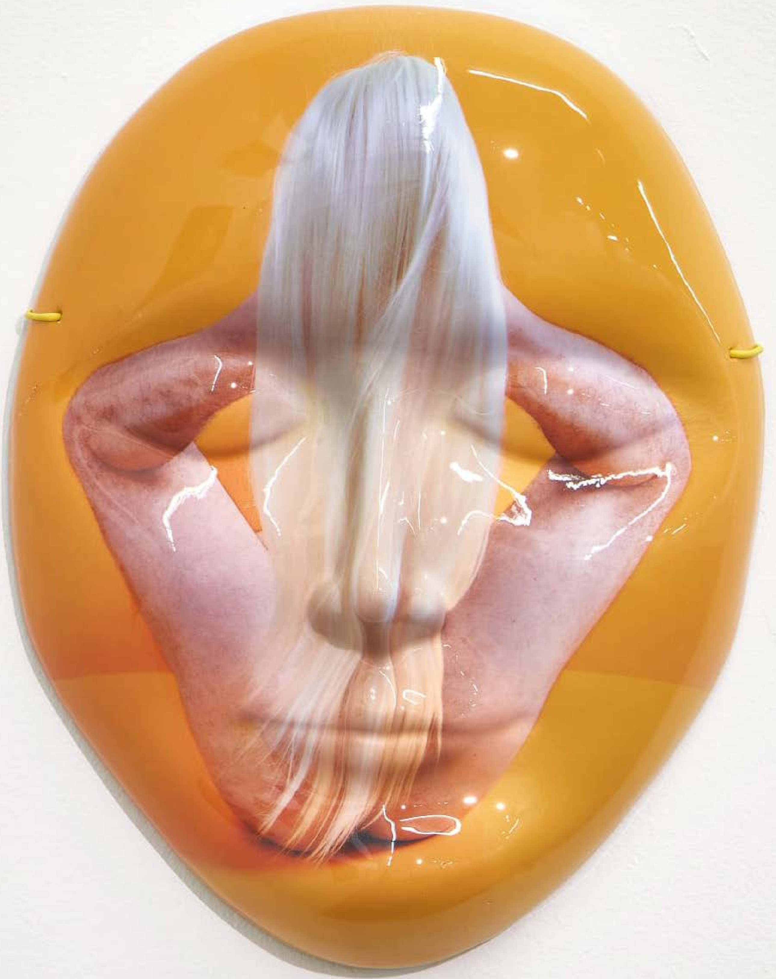
גיא און, ללא כותרת, עץ מצופה פלסטיק, הדפס מים 2021 Guy Aon, Untitled, wood with plastic coating, hydro print, 2021

הפסלים עליהם הודפסו צילומי גוף, נעשו בטכניקה חדשנית ללבישת פורטרט וזהות לאדם אחד באמצעות טכנולוגיה מבוססת עדשה. העבודות מביעות את הסלידה והמשיכה לבינה מלכותית על פי הצגתן את החומר האנושי.