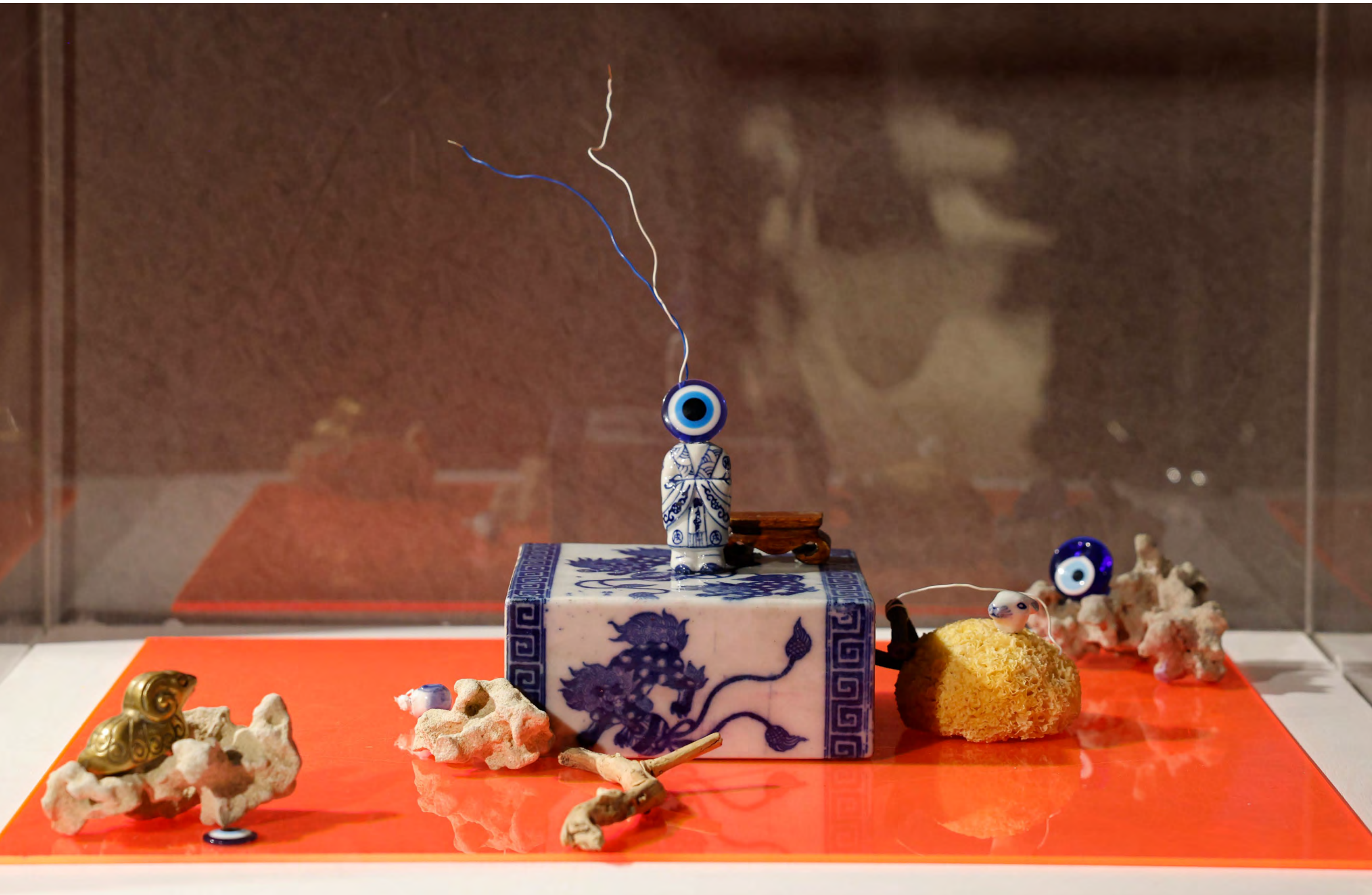
יעל ברונר רובין, כחול לבן ורוד מתוך (סדרת R We Awake), מיצב מדיה מעורבת, 2023 Yael Bronner Rubin, Blue, White, Pink , (R We Awake series), mixed-media installation, 2023