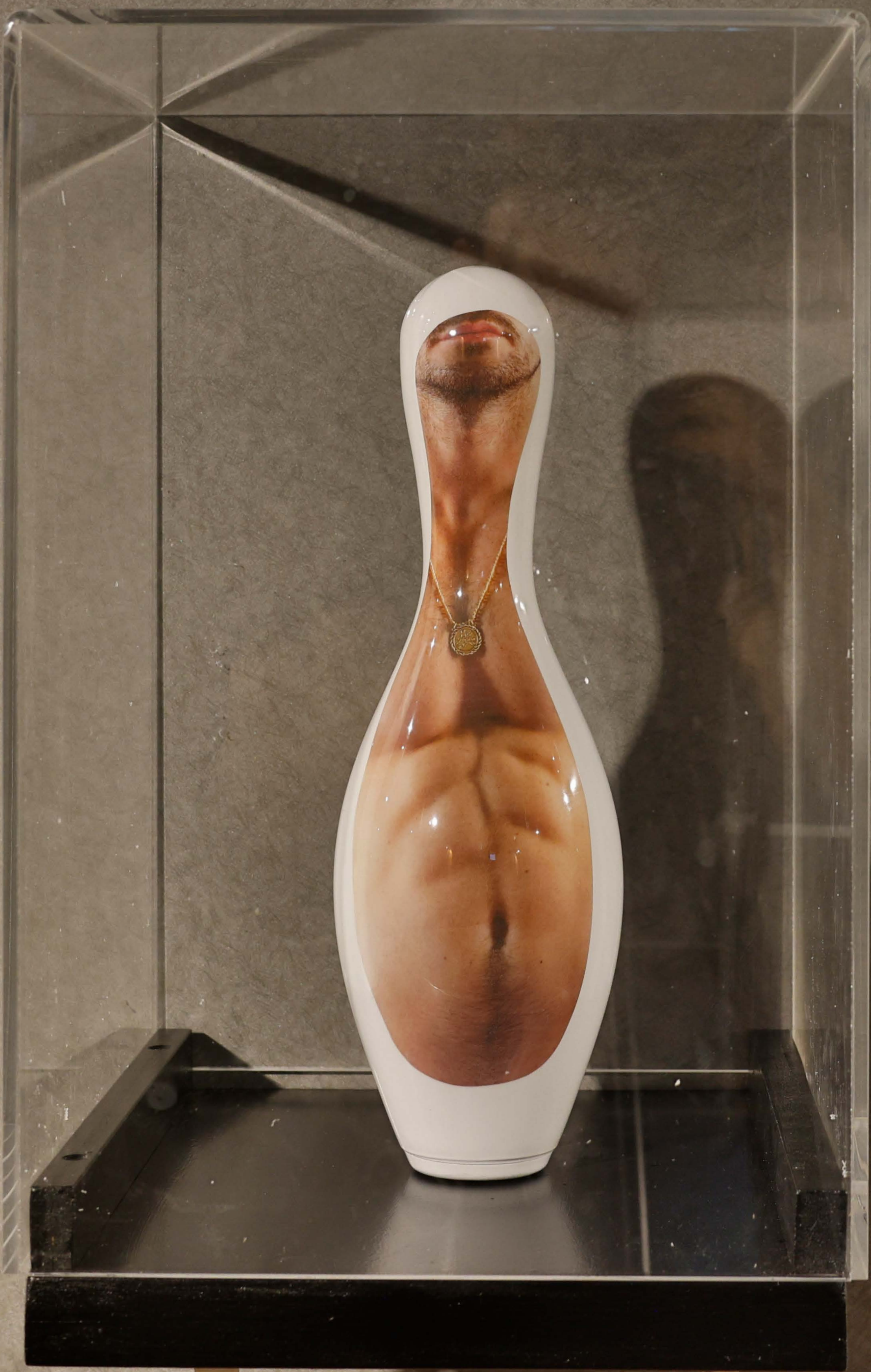
גיא און, ללא כותרת, קרמיקה והדפס מים, 2021 Guy Aon, Untitled , ceramic, hydro print, 2021

הפסלים עליהם הודפסו צילומי גוף, נעשו בטכניקה חדשנית ללבישת פורטרט וזהות לאדם אחד באמצעות טכנולוגיה מבוססת עדשה. העבודות מביעות את הסלידה והמשיכה לבינה מלכותית על פי הצגתן את החומר האנושי.